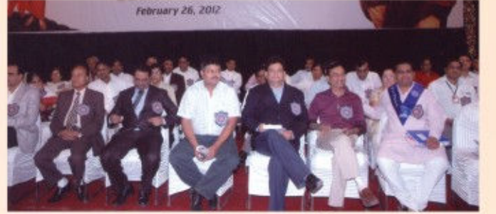
(સિન્ડિકેટના સભ્યશ્રીઓ અને વિવિધ વિદ્યાશાખાના અધ્યક્ષશ્રીઓ)