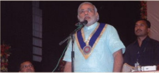
(દીક્ષાંત પ્રવચન : માનનીય મુખ્યમંત્રીશ્રી નરેન્દ્રભાઈ મોદી)