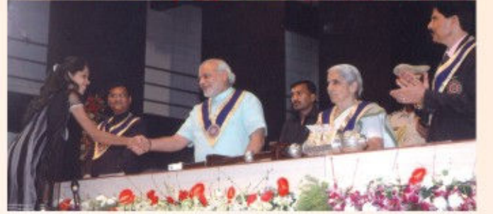
(ચંદ્રકો અને પારિતોષિક વિતરણ)